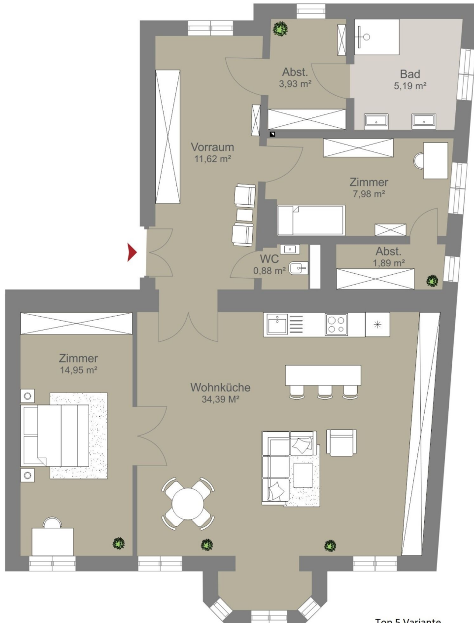
Top 5 Variante