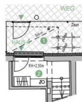
GRUNDRISS EG Eingangsniveau