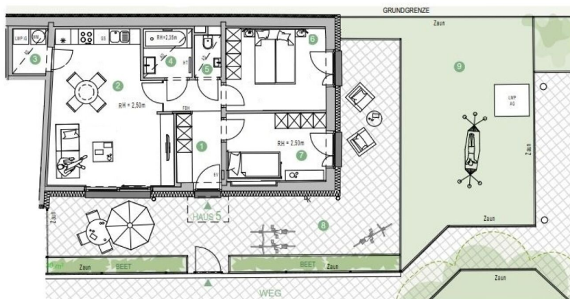
GRUNDRISS EG Eingangsniveau