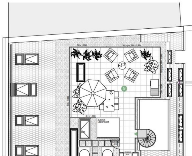
GRUNDRISS DACHTERRASSE 2

9 DACHTERRASSE 2 Betonsteinplatte 46,32m 2