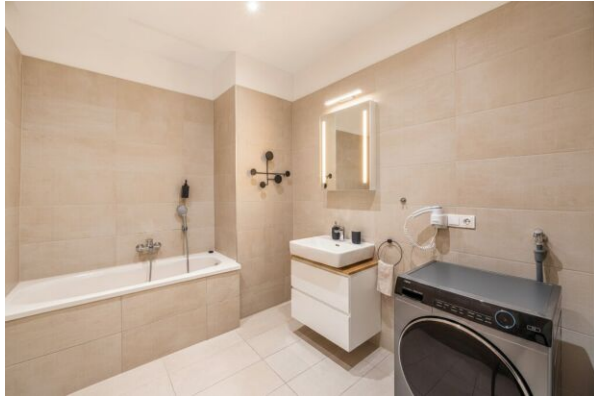
Badezimmer KI Bearbeitet