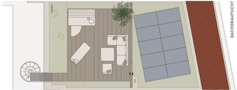
DACHDRAUFSICHT Version: 09/06/25