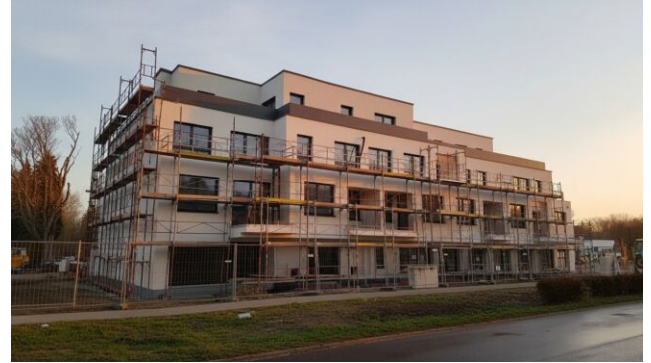
Aktueller Baufortschritt Q1 2026