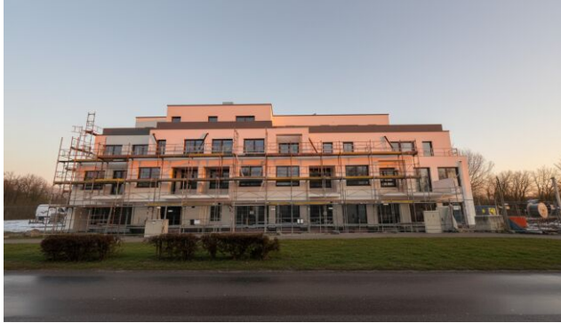
Aktueller Baufortschritt Q1 2026