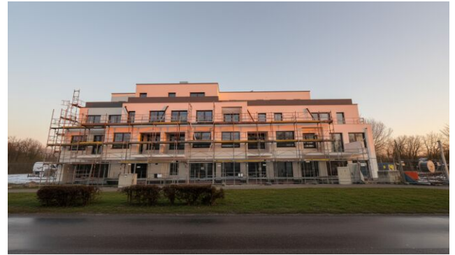
Aktueller Baufortschritt Q1 2026