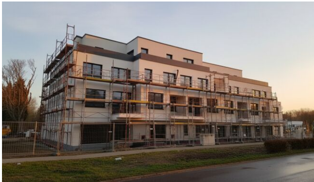
Aktueller Baufortschritt Q1 2026