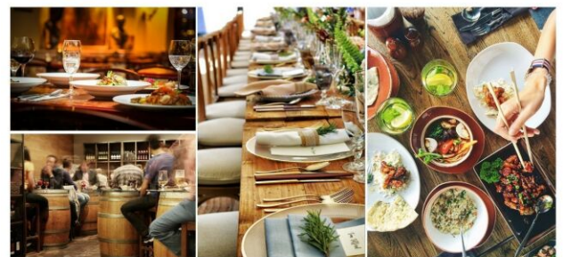
Mit verschiedenen Restaurants, Gasthöfen und Heurigen in der Nähe ist für das leibliche Wohl gut gesorgt.