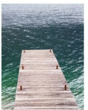
Die Badeseen Gerasdorf und Süßenbrunn laden ein zur Entspannung, Aktivitäten oder zum genießen der Natur.