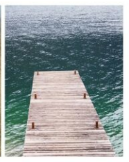
Die Badeseen Gerasdorf und Süßenbrunn laden ein zur Entspannung, Aktivitäten oder zum genießen der Natur.