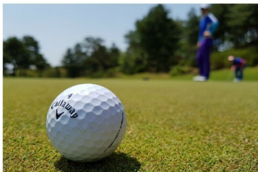
Der Golf Club Wien-Süßenbrunn ist nur wenige Autominuten entfernt und bietet auch andere Aktivitäten an.