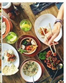
Mit verschiedenen Restaurants, Gasthöfen und Heurigen in der Nähe ist für das leibliche Wohl gut gesorgt.