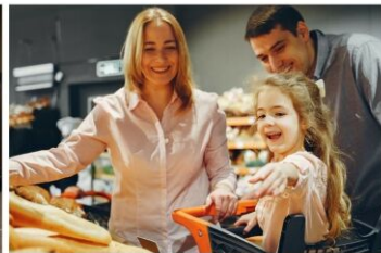
Mit einer SPAR- und einer Hoferfiliale in der Nähe können die Einkäufe des täglichen Bedarfs direkt erledigt werden.